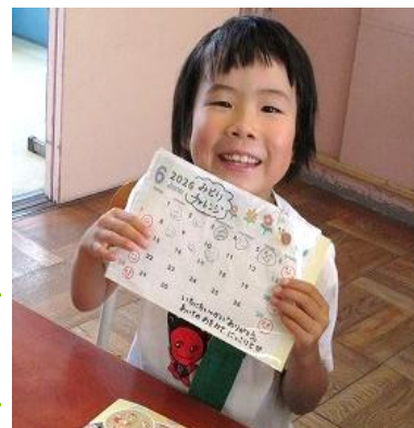
チャレンジできたよ!